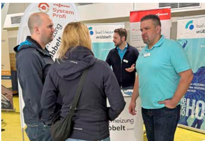
Auch der Bottroper SHK-Betrieb Wübbelt präsentierte Ideen für nachhaltiges Sanieren, Modernisieren und Bauen.